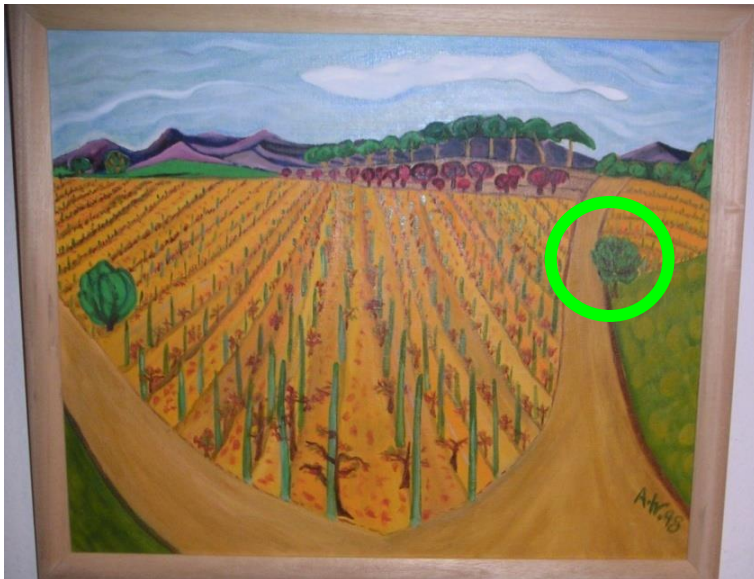
Andreas Weißgerber: Las montañas de esta imagen son más planas que las de los otros cuadros.

¿Hay cosas que cada artista representa u omite de manera diferente?