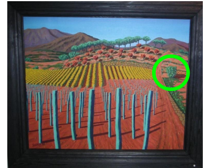
Helmut Schack: En esta imagen, es evidente que el campo se extiende de forma diferente hasta el horizonte. El paisaje es colorido. En comparación con las otras imágenes, el grupo de árboles del horizonte es más visible.