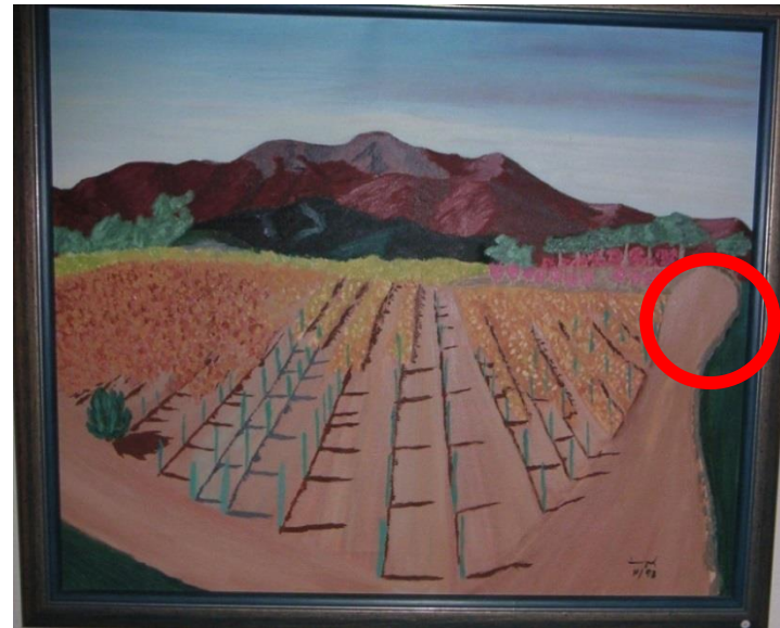
Bernd Hampel: Los colores de este paisaje son mucho más terrenales que los otros. El árbol de la derecha del camino no aparece (círculo rojo).